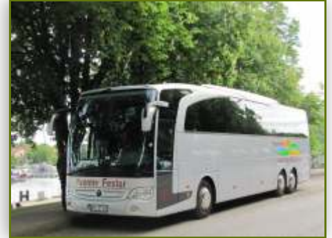
Tagesausflüge & Mehrtagesreisen

Schorfheide Touristik | Kreuzstr. 25 | 16225 Eberswalde